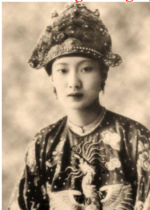
Nam Phương Hoàng hậu Hoàng hậu Việt Nam Hoàng hậu nhà Nguyễn