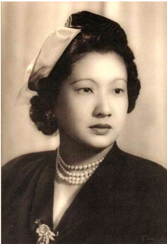
Nét quý phái của Hoàng hậu Nam Phương trong Âu phục, đầu thập niên 1950