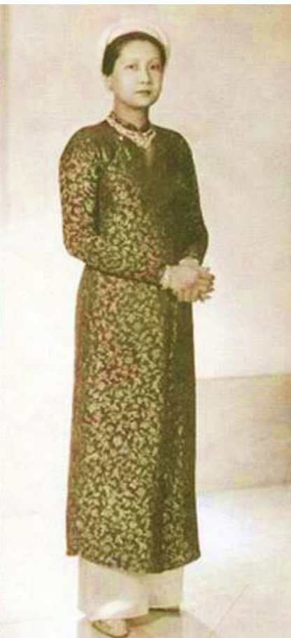
Nam Phương Hoàng hậu khi mới vào Hoàng cung và khi đã ngoài 30 tuổi