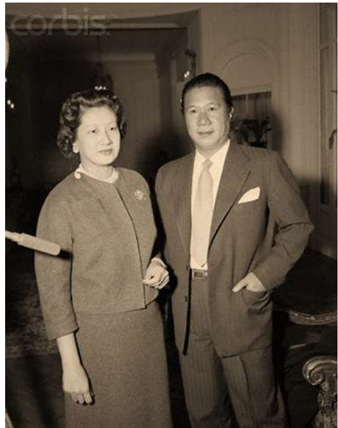
Nam Phương Hoàng hậu và cựu hoàng Bảo Đại ở Paris năm 1955