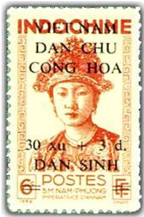
Hoàng hậu Nam Phương trên một con tem Đông Dương thuộc Pháp, sau đó Việt Nam Dân chủ Cộng hòa sử dụng lại