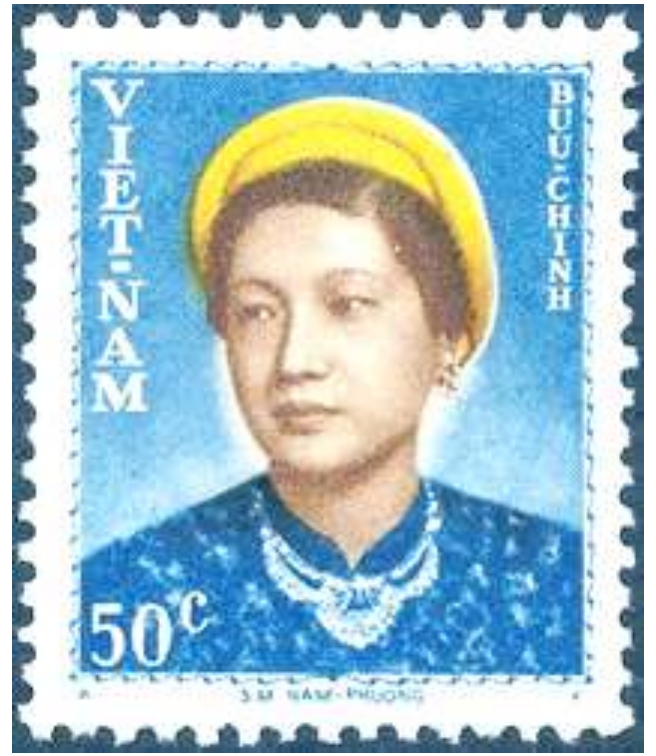
Hoàng hậu Nam Phương trên một con tem Quốc gia Việt Nam