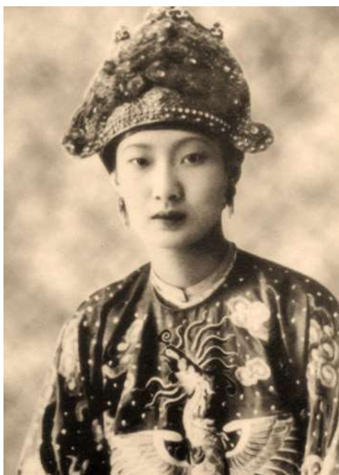
Hoàng hậu Nam Phương mặc hoàng phục, bức ảnh được biết đến nhiều nhất của bà