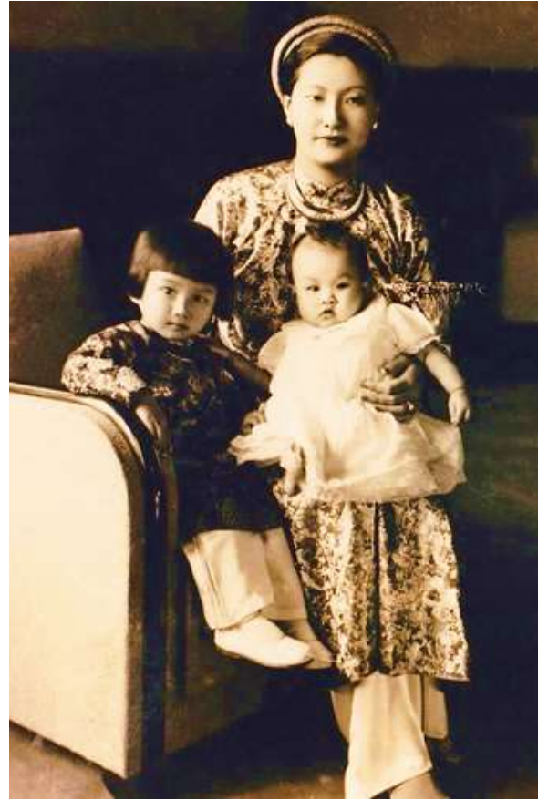
Hoàng hậu Nam Phương với Hoàng tử Bảo Long và Công chúa Phương Mai