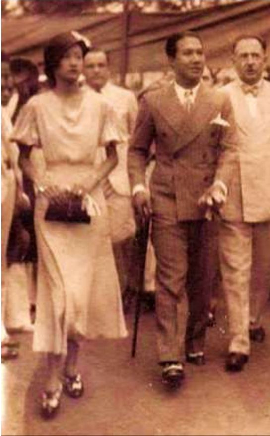
Hoàng hậu Nam Phương và vua Bảo Đại