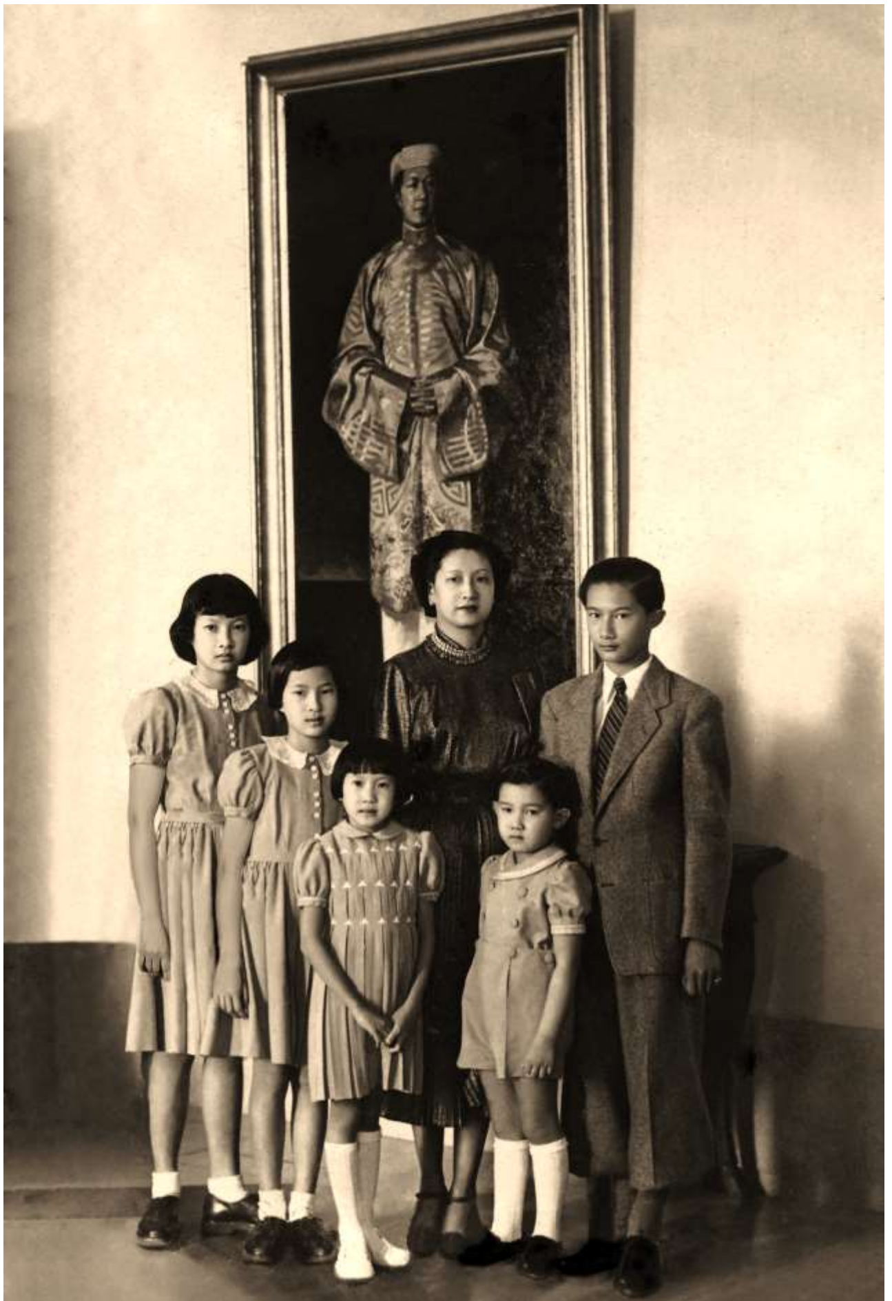
Hoàng hậu Nam Phương cùng các con, phía sau là bức ảnh của Bảo Đại