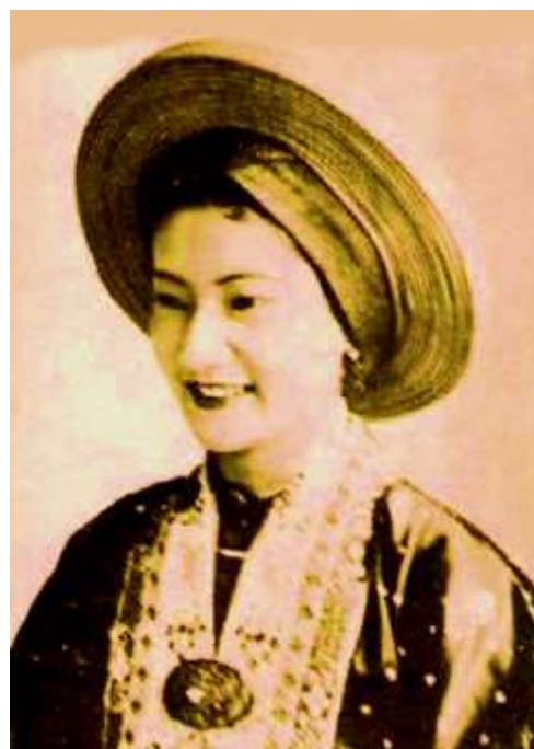
Nam Phương Hoàng hậu khi ngoài 20 tuổi