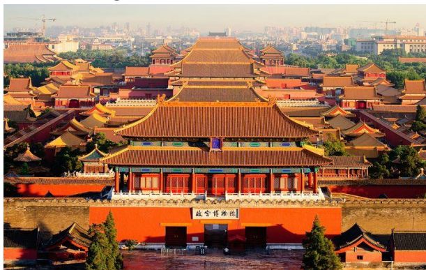
Toàn cảnh cố đô Bắc Kinh