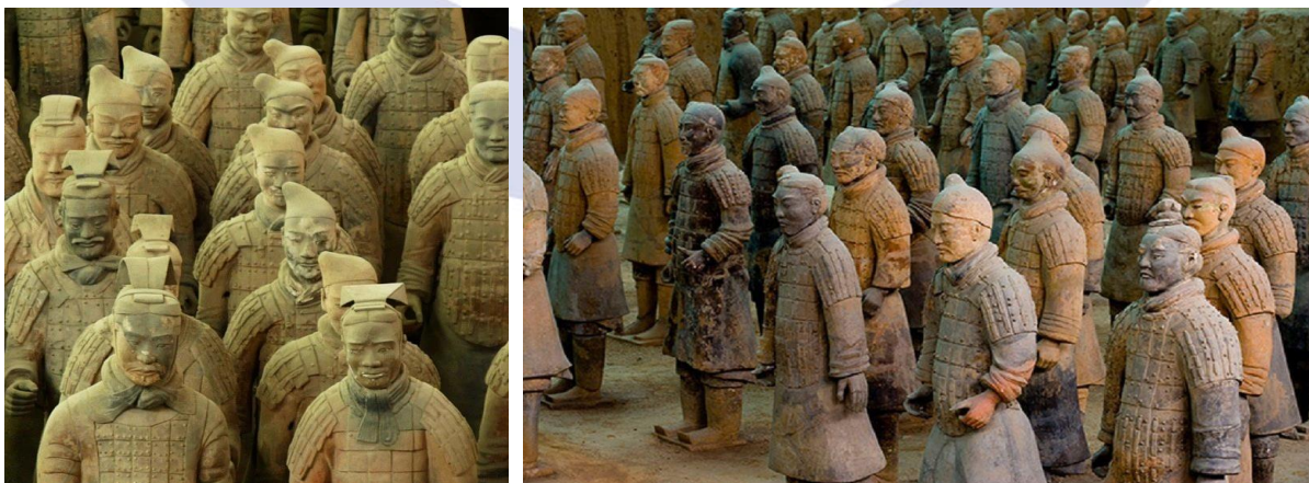
Tượng người bằng đất nung trong lăng mộ Hoàng đế Tần Thủy Hoàng