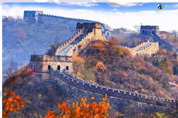
Vạn Lý Trường Thành