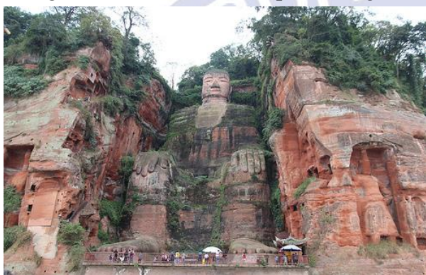
Đại Phật Lạc Sơn

Đạt nhiều thành tựu tiêu biểu như: Vạn Lý Trường Thành, Cố Cung Bắc Kinh hay hệ thống chùa chiền với nhiều pho tượng Phật được chế tác có độ tinh xảo cực kỳ cao.