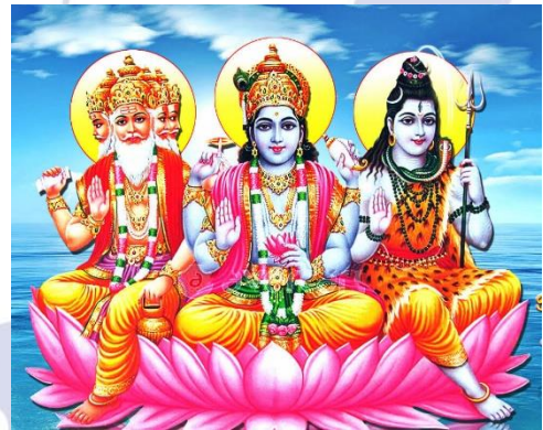
Bộ ba Trimurti – Tam thần Ấn giáo