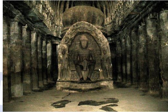
Chùa hang Ajanta – di sản văn hóa lớn nhất ở Ấn Độ