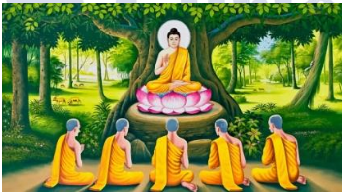
Phật giáo Ấn Độ