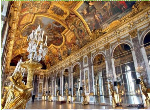
Cung điện Véc-xai