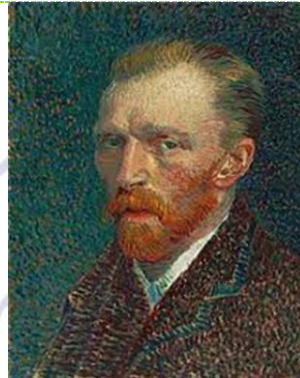
Van Gốc (Hà Lan)