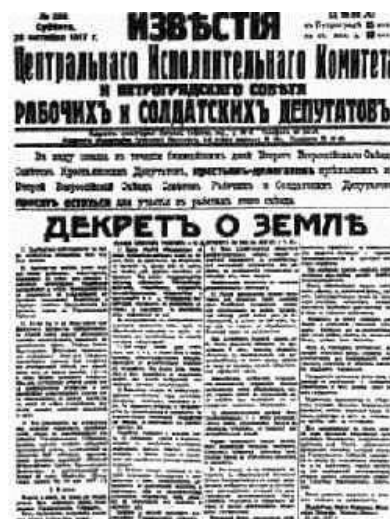
Đại hội Xô viết toàn Nga lần II