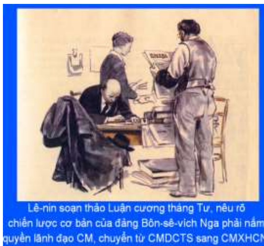
Lênin soạn thảo Luận cương tháng Tư, nêu rõ chiến lược cơ bản của đảng Bôn-sê-vích Nga phải nắm quyền lãnh đạo CM, chuyển từ CMDCTS sang CMXHCN

- Cách mạng tháng Hai thành công, tình hình chính trị phức tạp chưa từng có đã diễn ra ở nước Nga – tình trạng hai chính quyền song song tồn tại, Lênin và Đảng Bôn-sê-vích đã chuẩn bị kế hoạch tiếp tục làm cách mạng, lật đổ Chính phủ tư sản lâm thời (Luận cương Tháng Tư)