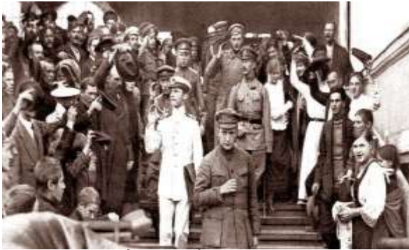
Xô viết đại biểu