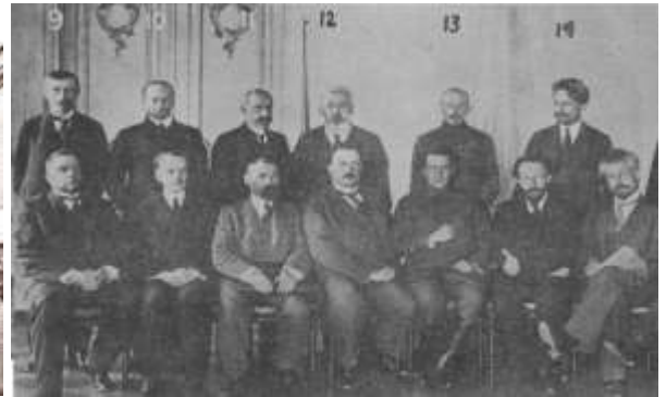
Chính phủ tư sản lâm thời

=> hai chính quyền đại diện cho quyền lợi của 2 giai cấp khác nhau nên không thể song song tồn tại -> cần chấm dứt, Luận cương Tháng Tư (4/1917) đã chỉ ra mục tiêu và đường lối chuyển từ CMDCTS sang CMXHCN.