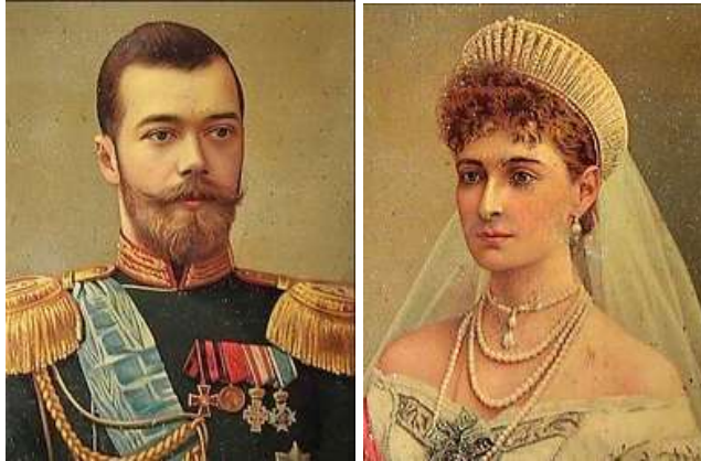
Vợ chồng Nga hoàng Ni-cô-lai II.